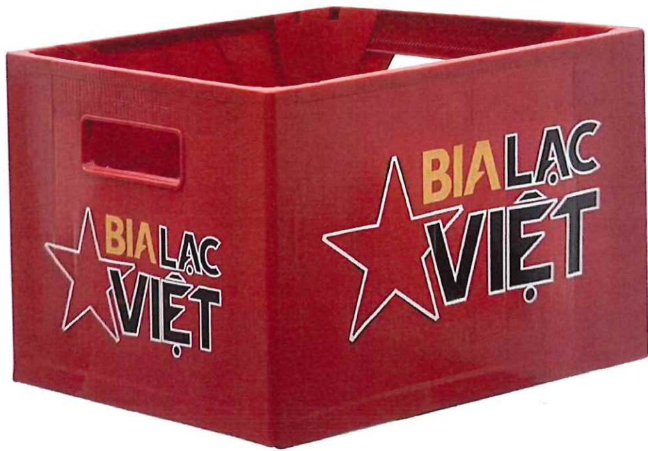
MẶT TRƯỚC & SAU/ FRONT & BACK